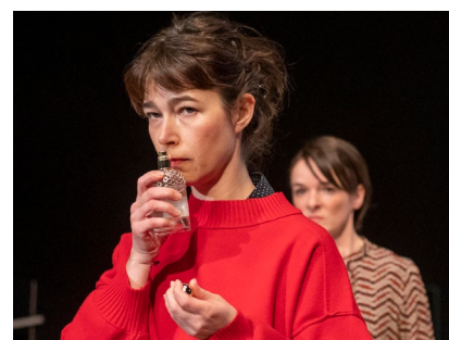
TOUTE LA VÉRITÉ