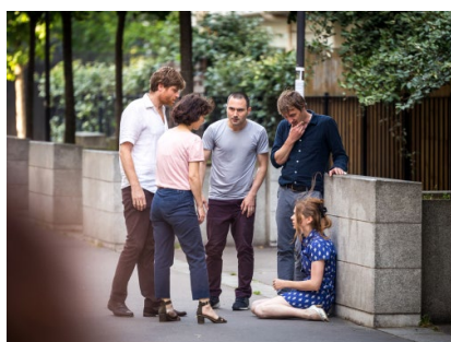
LES PIÈCES MANQUANTES ( PUZZLE THÉÂTRAL )